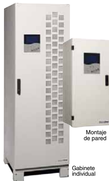
Montaje de pared